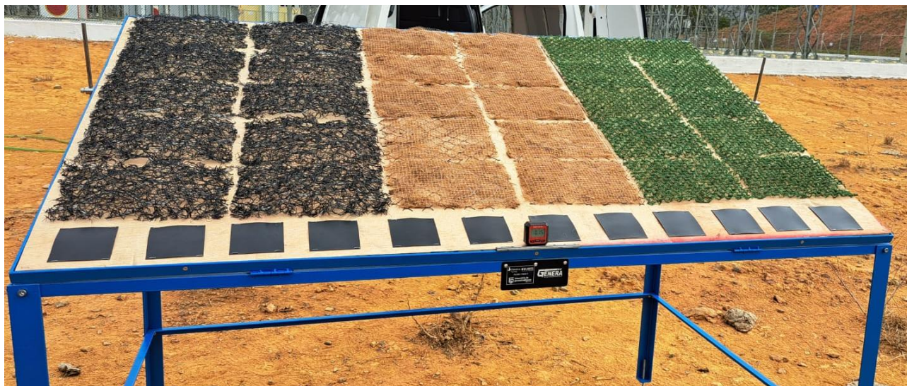
Figura 2. Painel com exposição com as geomembranas na parte inferior.