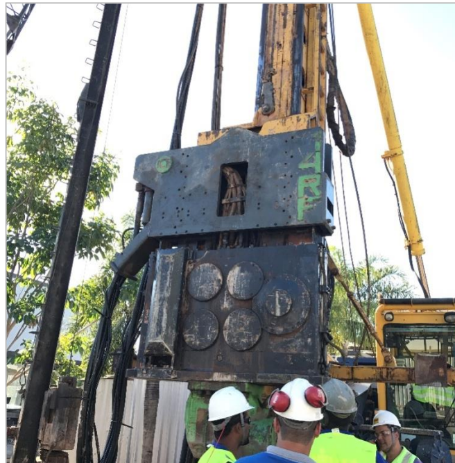
Figura 1. Martelo vibratório utilizado em estudo de caso abordado neste artigo.

De acordo com o Deep Foundations Institute (2015), a principal desvantagem do método é a falta de controle executivo confiável, quando comparado ao das estacas cravadas por impacto. No método convencional de cravação o diagrama de cravação consiste em um “ensaio” de campo na vertical da estaca cravada. Em alguns casos, o martelo de queda livre é utilizado para a checagem da capacidade de carga e se for necessário, realizar a recravação. Essa checagem acaba reduzindo o benefício econômico e ambiental do método de cravação por vibração.