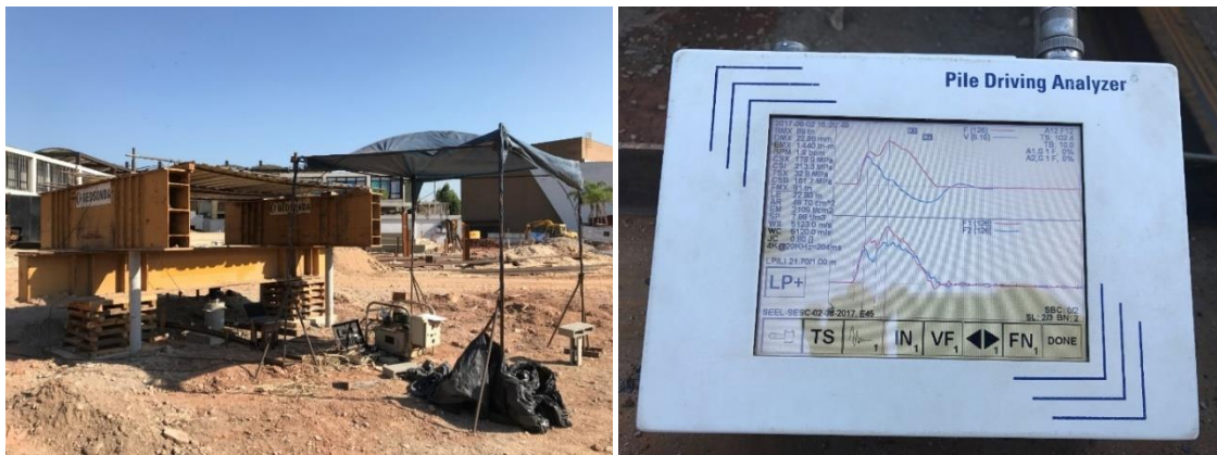
Figura 2. (a) PCE em execução (b) PDA ( Pile Driving Analyzer ) utilizado nos ensaios de carregamento dinâmico (Tsuchiya, 2021) - estudo de caso abordado neste artigo.

A prova de carga estática lenta (PCE), regulamentada pela NBR16903:2020, consiste basicamente em se determinar a capacidade de carga da estaca por meio da interpretação da curva carga versus recalque gerada através dos resultados da instrumentação do ensaio. Diferentes carregamentos aplicados em estágios pré-determinados geram recalques medidos, quando o critério da estabilização dos recalques é atingido, por extensômetros ( strain gauges ) que são utilizados para a geração da curva carga versus recalque.