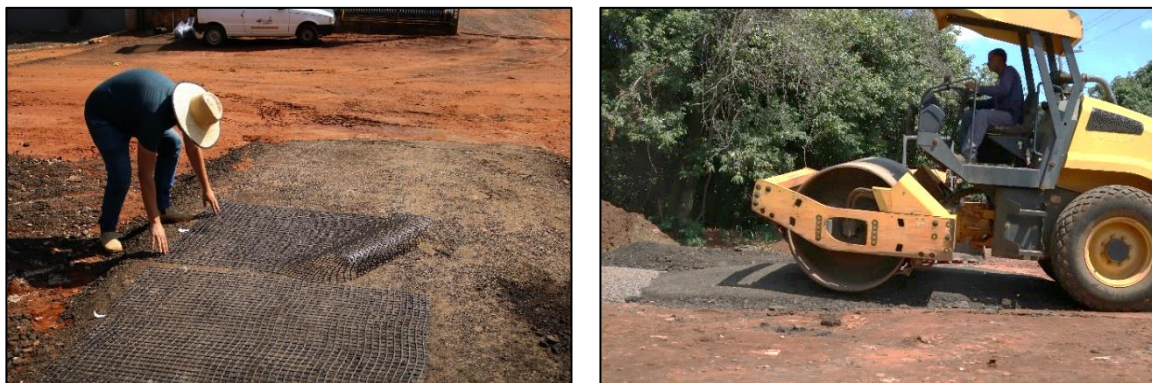
Figura 1 – Procedimento experimental para ensaio de dano de instalação em campo em geogrelhas e agregado RAP.

Em campo, após a compactação da camada inicial de RAP, foram instalados painéis de geogrelhas de 1,10 x 1,50 m. Durante a instalação, as geogrelhas foram fixadas para que não se movessem através do agregado durante a passagem do rolo. Sobre as geogrelhas, foi compactada uma camada de 20 cm de agregado RAP. Após a conclusão da instalação das geogrelhas e camadas compactadas de agregado RAP, as amostras foram deixadas em campo por um curto período de tempo (48 horas) antes de serem exumadas. A Figura 1 apresenta respectivamente a camada compactada de RAP, as geogrelhas instaladas e o equipamento de compactação sobre a camada de RAP.