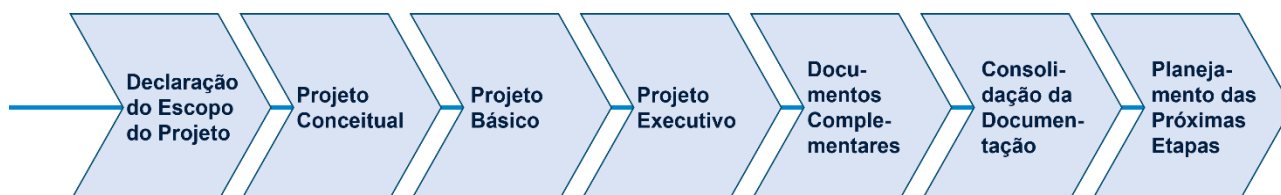
Figura 1. Fluxograma da estrutura geral do guia proposto.