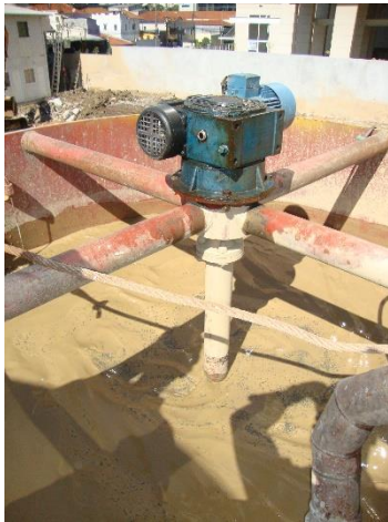
Figura 4 – Processo de mistura na etapa de floculação

Após retirar o material sólido do Floculador, foi realizada a mistura com o solo derivado do processo de escavação e, posteriormente, descartados em aterro. Entretanto, é necessário realizar o tratamento da água proveniente do processo de floculação. Para isso, a água residual passou por um processo de filtragem, utilizando o filtro de brita e, em seguida, destinada ao coagulador. Nessa etapa, foi adicionado coagulante na água em repouso, sendo submetida logo depois ao processo de agitação para mistura dos elementos até formar flocos, como mostrado na figura 5.