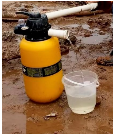
Figura 6 - Filtragem em filtro pressurizado de areia tratada

Para retenção dos flocos de menor dimensão formados por suspensão coloidal, a água residual foi encaminhada ao filtro de areia tratada (figura 6), o qual realiza a filtragem de forma inversa, ou seja, de baixo para cima. Devido a essa condição, o filtro demanda de uma maior pressão para superar a carga da areia. Desse modo, o processo foi dado como finalizado, o qual foi possível obter uma água própria para reuso, conforme classificação CONAMA 430/2011.