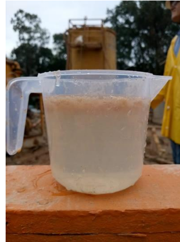
Figura 5 – Amostra de afluente após coagulação

Para retenção dos flocos de menor dimensão formados por suspensão coloidal, a água residual foi encaminhada ao filtro de areia tratada (figura 6), o qual realiza a filtragem de forma inversa, ou seja, de baixo para cima. Devido a essa condição, o filtro demanda de uma maior pressão para superar a carga da areia. Desse modo, o processo foi dado como finalizado, o qual foi possível obter uma água própria para reuso, conforme classificação CONAMA 430/2011.