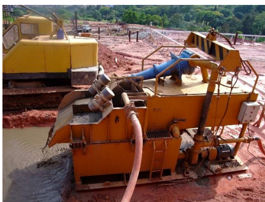
Figura 1 – Vista do Reciclador