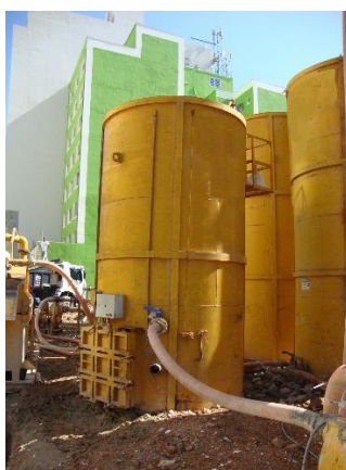
Figura 2 - Vista do floculador

Desse modo, para realizar o descarte adequado, atendendo aos fatores definidos na ABNT NBR 10004 e na resolução CONAMA 430/2011, é necessário misturar um material floculante à lama bentonítica para separá-la, possibilitando assim o descarte correto. Essa mistura é feita através de um floculador, vide figura 2, processo conhecido como Floculação.