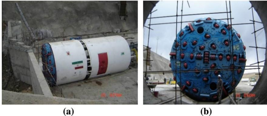
Figura 1. TBM de blindagem dupla (double-shield) (a) durante a montagem e (b) uma visão da cabeça de corte (HASSANPOUR et al., 2009).

A tunneladora é uma máquina usada para a escavação de túneis com uma cabeça de corte circular equipada com cortadores de disco, brocas de arrasto, raspadores e facas de corte (Figura 1). No passado, métodos convencionais de escavação de túneis, como métodos de perfuração e explosão e/ou escavadeiras mecânicas eram frequentemente empregados. Hoje em dia, com os avanços na tecnologia de TBMs, o uso de TBMs tem aumentado significativamente (YOUNG KO; MO SON; KON KIM, 2017).