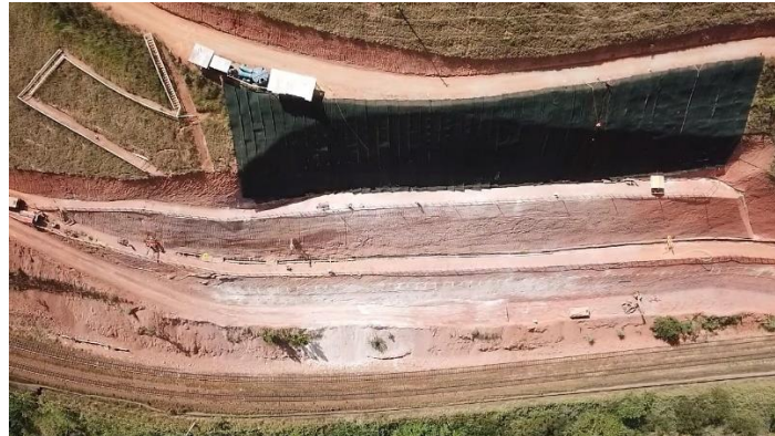
Figura 6. Execução pelo método descendente

Por fim, foi aplicada a hidrossemeadura com mix de sementes por cima do sistema de MacMat R1 através do caminhão tanque utilizado na aplicação da hidrossemeadura.