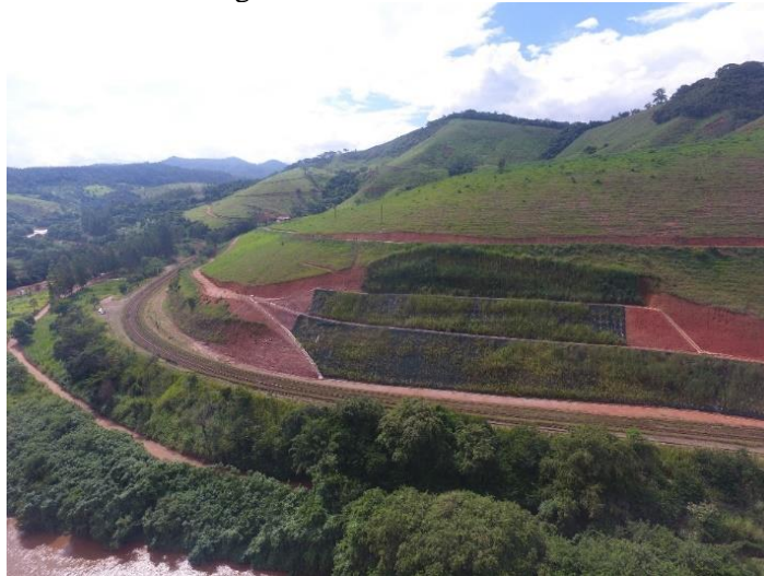
Figura 8. Obra finalizada (após 1 mês)

De uma maneira geral a aplicação da técnica de estabilização de solo grampeado verde, envolve uma série de vantagens, não só do ponto de vista de execução, uma vez que permite que a sua execução seja feita com equipamentos menores e menos materiais de construção, permitindo o acesso a lugares, com alta complexidade, tempos menores de execução, adaptação fácil a materiais heterogêneos, que influencia muito na perfuração e injeção, rapidez na execução, sendo uma grande vantagem em regiões onde o período de chuva, muitas vezes, inviabilizam as obras. Este tipo de técnica, possibilita o ajuste de projeto, quando necessário. E oferece também ótimos resultados no que respeita o baixo impacto ambiental e visual, permitindo uma face drenante, possibilitando o recobrimento vegetal da área.