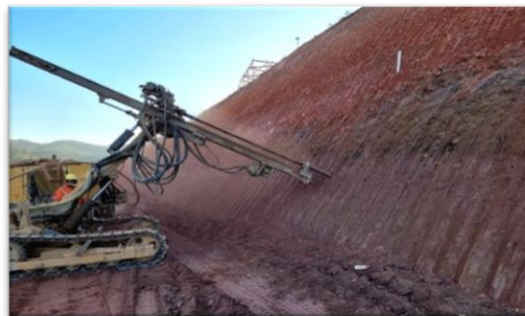
Figura 4: PW 5000

Para o talude denominado de “Talude 2”, a metodologia de escavação adotada, foi o corte por completo e logo a perfuração realizada por equipe especializada em acesso por corda e equipamento de perfuração conhecido como wagon drill, conforme figura 5, ficando ancorado no próprio talude durante a execução. Porém, seguindo o mesmo conceito executivo do talude 1, no que respeita furos, inserção dos chumbadores, injeção da calda de cimento e posteriormente o torqueamento da barra