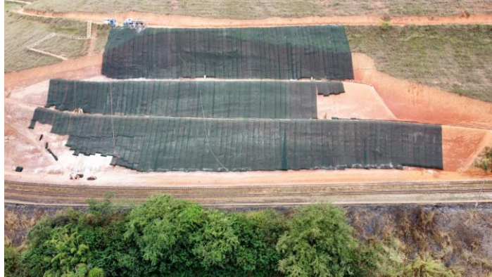
Figura 7. Instalação do sistema de telas MacMat R1

A aplicação da técnica de hidrossemeadura pode ser feita antes ou após a instalação do sistema de malhas, oferecendo mais uma vantagem executiva deste tipo de solução.