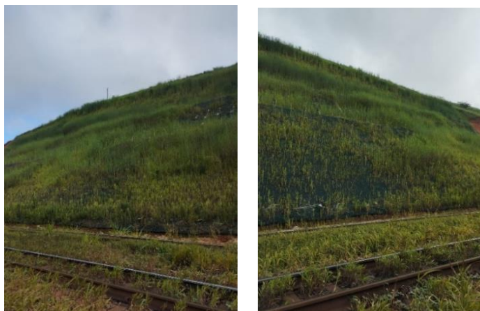
Figura 9. Obra finalizada (após 5 mês)