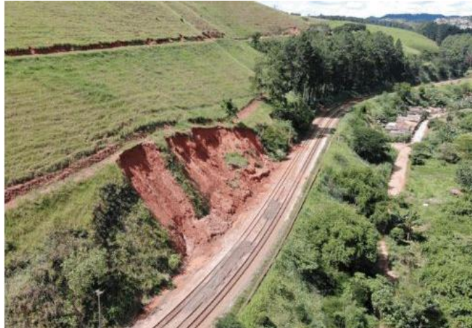
Figura 2. Área antes da estabilização

Nos últimos anos, a área do talude vem sofrendo com a instabilidade superficiais provocadas, principalmente pelos eventos de chuva no período de verão, sendo que no ano de 2020, as chuvas foram muito intensas, levando à desconfiguração quase no total da geometria inicial do corte, oferecendo risco à infraestrutura próxima a este ponto, conforme observado na Figura 2.