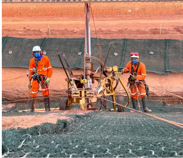
Figura 5: Perfuração do talude 02 com Wagon Drill

Já para o talude 3, próximo da base, foi adotada a mesma metodologia do talude 1, perfuração motorizada com a PW 5000. Toda perfuração, instalação de chumbadores e injeção de calda foram feitos com equipe de corda. A instalação da tela MacMat R1 foi executada de duas maneiras diferentes ao longo do serviço, conforme mostrado na figura 6. Nos taludes 1 e 3, realizou-se os furos inicialmente, depois colocaram as mantas e posteriormente seguiu a sequência de colocação dos chumbadores. Já no talude 2, devido ao acesso por corda ter sido utilizado para perfuração, realizou-se colocação da tela inicialmente, e depois realizou-se a perfuração. As técnicas adotadas possuem dificuldades em relação a logística, segurança da equipe envolvida, manipulação dos equipamentos, dificuldade nos acessos e taxas de produtividades variadas em relação a condição do solo e geometria.